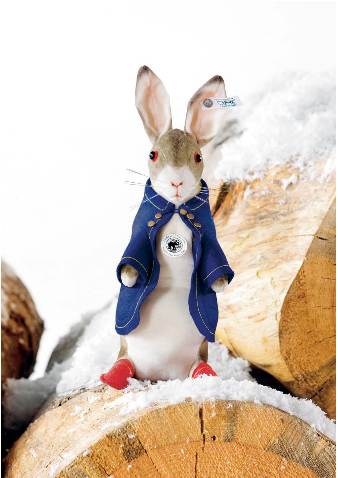
Diese prächtige Replik aus Baumwollwamt ist praktisch nicht von ihrem Original im Steiff Archiv zu unterscheiden!