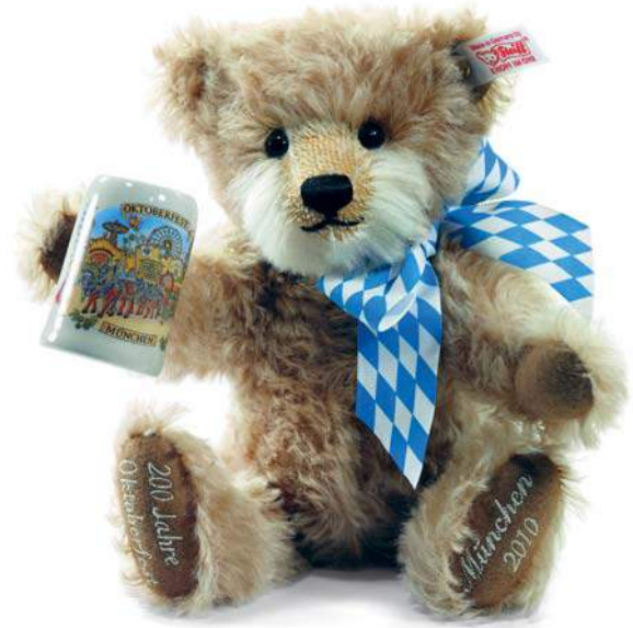
Teddybär Kaufhof Oktoberfest 2010 (EAN 657177)

Erhältlich ist der auf 1.000 Exemplare limitierte, 5-fach gegliederte Teddybär aus hellbraunem Mohair unter der EAN 657177 ausschließlich bei der Galeria Kaufhof, München am Marienplatz, Tel.: +49 (0) 89.23 185-668, Fax: +49 (0) 89.23 185-281.