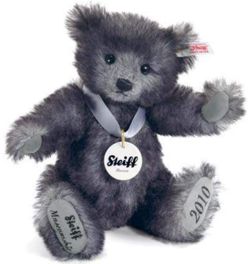
Der Museumsbär 2010 (EAN 673177)

Bereits seit dem Jahr 1998 wurde für das Steiff Museum jährlich ein Museumsbär gefertigt. Diese Serie wurde nicht unterbrochen, sondern auch für das im Jahr 2005 neu eröffnete Erlebnismuseum fortgesetzt und erfreut sich allgemein großer Beliebtheit. Dieser Artikel wurde in traditioneller Handarbeit aus feinstem grau-gespitztem Alpaca gefertigt. Seine Sohlen sind bestickt, und er trägt ein graues Satinband mit Porzellanplakette, die das „Steiff Museum“-Logo zeigt. Jeder Bär trägt ein weißes, fortlaufend nummeriertes Ohrfähnchen und einen vergoldeten „Knopf im Ohr“. Der Artikel ist auf das Jahr 2010 limitiert.