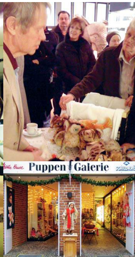
Hat bärigem Zuwachs erhalten: die Puppen Galerie in Kevelaer