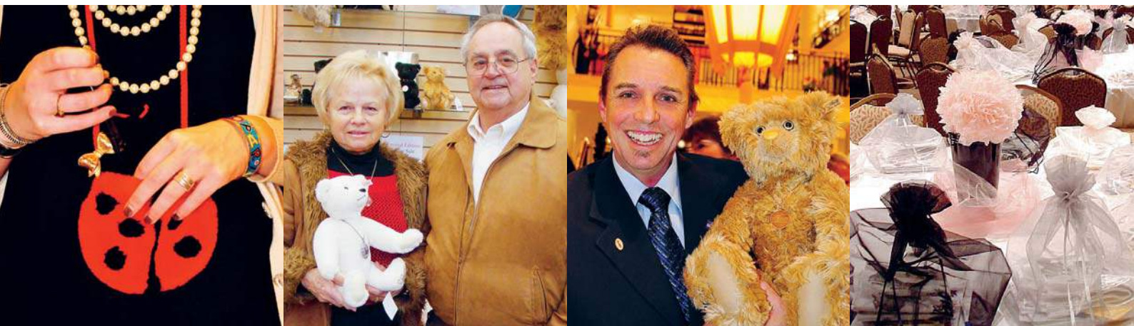
Die Steiff Marienkäfer-Tasche: ein Blickfang bei einem Event in San Francisco

Information, Spaß und Unterhaltung mit Steiff