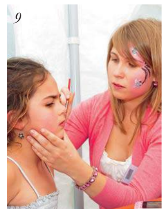
1. Aufregung und Spannung bei der Nagel-Auktion. 2. Gala-Dinner, inszeniert mit allem Pomp und Prunk. 3. Wunderbare Schnäppchen in den Verkaufszelten. 4. Teddys und Sammler kamen mit allen möglichen Transportmitteln zum Steiff Sommer. 5. In den Verkaufsräumen drängten sich Käufer um die vielen schönen Angebote. 6. Gleich geht's los: Die Geburtstagstorte wird angeschnitten. 7. Der Teddybär-Workshop: ein lang gegebter Wunschtraum wird wahr! 8. PGB 35 als Schaustück im Museum. 9. Sehr beliebt: Das Kinderschminken.