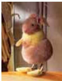
Maus aus Nomotta-Wolle, 9 cm, von 1956 bis 1942.