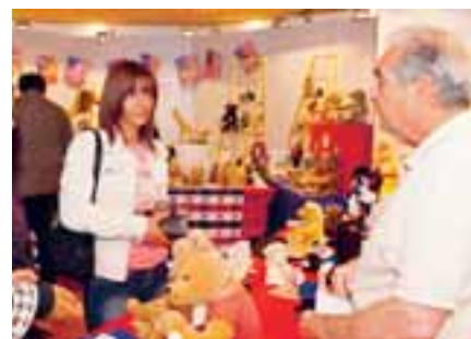
Für jeden etwas zu haben: Steiff Händler aus aller Welt boten ihre „Schätze“ an.