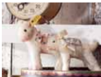
Lämmer aus Nomotta-Wolle, erhältlich in den Größen 7 und 10 cm, von 1955 bis 1941.