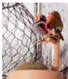
Rotkehlchen und Sperling aus Nomotta- Wolle, erhältlich in den Größen 4 und 8 cm, von 1934 bis 1943.