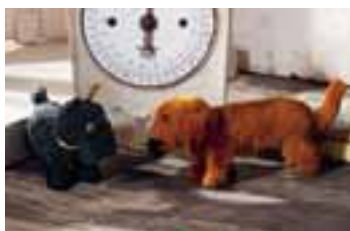
Scottish Terrier aus Nomotta-Wolle, erhältlich in den Größen 8, 10, 14 und 17 cm, von 1955 bis 1959; und Dackel, 10 cm, von 1955 bis 1959.

Die Wollminiaturen feierten ihr Debüt im 1931er Steiff Katalog in Form von sechs schlichten Vögelchen, die in unterschiedlichen Farben und in den Größen 4 und 8 cm erhältlich waren. Ihre Beine bestanden aus Draht, Schwanz und Schnabel aus Filz. Den für Steiff typischen Knopf und die gelbe Ohrfahne trugen die Vögel als winzige „Armbänder“ um ihre kräftigen Beinchen. Trotz ihrer geringen Größe und dem niedrigen Preis wurden sie mit der gleichen hochwertigen Qualität wie teurere Tiere hergestellt. In den Firmenunterlagen wurden sie als „Spielzeug für unsere