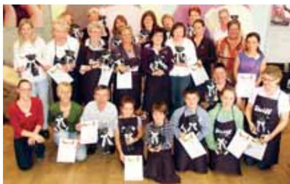
Glückliche Gesichter bei den Teddybären-Workshops.