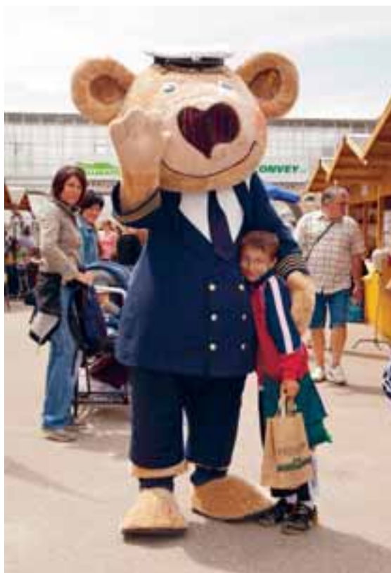
Käpt'n Knopf begrüßte die Besucher und lud Kinder und ihre Eltern zu den Hapag Lloyd Kreuzfahrten ein.