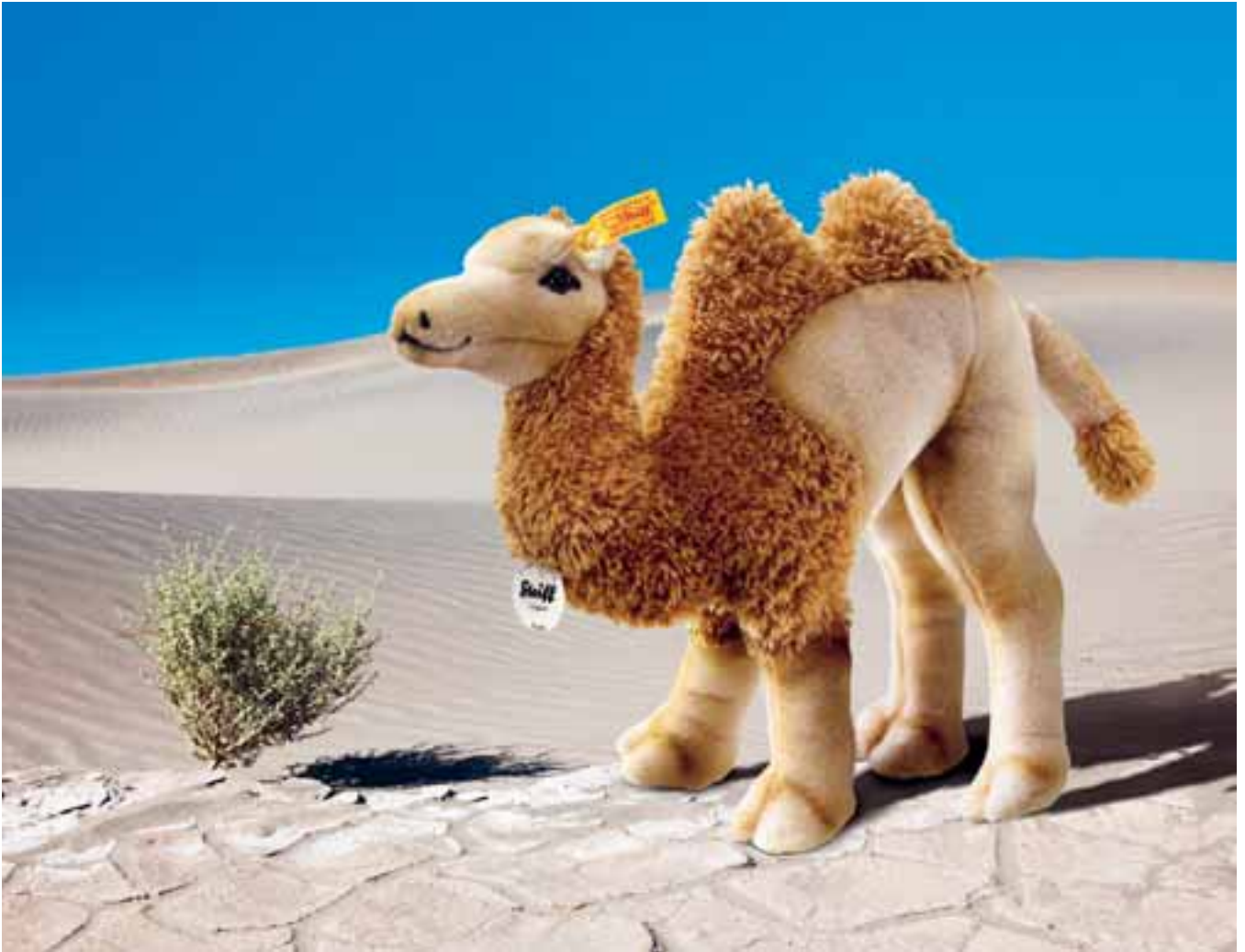
Das Baktrische Kamel von Steiff ist aus flauschig weichem Plüsch und hochwertigem Webpelz hergestellt. (EAN 104169, 32 cm)