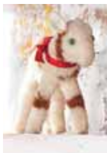
Ziege aus Nomotta-Wolle, erhältlich in den Größen 10 und 17 cm, von 1955 bis 1941.