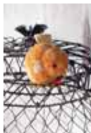
Orange-weißer Vogel aus Nomotta- Wolle, erhältlich in den Größen 4 und 8 cm, von 1931 bis 1934.