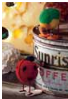
Marienkäfer aus Nomotta- Wolle, 7 cm, von 1958 bis 1943.