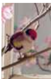
Fink aus Nomotta-Wolle, erhältlich in den Größen 4 und 8 cm, von 1933 bis 1943.