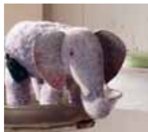
Elefant aus Nomotta-Wolle, 10 cm, von 1956 bis 1942.