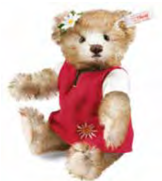
Peter ist der Nachfolger von Heidi aus der Frühjahrskollektion 2014.

„Heidi und Peter gehören einfach zusammen. Ein Leben ohne einander können sie sich gar nicht vorstellen. Selbst als sie im Gang der Ereignisse voneinander getrennt werden, sind sie sich gewiss, dass auch die Ferne ihrer Freundschaft nie etwas anhaben wird. Steiff erweckt Heidis Gefährten nun mit Peter Teddybär zu neuem Leben. Er hat ein etwas dunkler glänzendes Fell aus gespitztem Mohair. Nase und Mund sind von Hand gestickt. Das Fell ist im Schnauzenbereich geschoren. Hose und Weste sind aus Wollfilz genäht. Wie Heidis Kleidchen ist auch Peters Weste mit einem Edelweiß bestickt. Mit einer Höhe von 15 Zentimetern ist er genauso groß wie Heidi. Nach der Vorstellung von Heidi im Frühjahr 2014 wird Peter in der Herbstkollektion folgen.