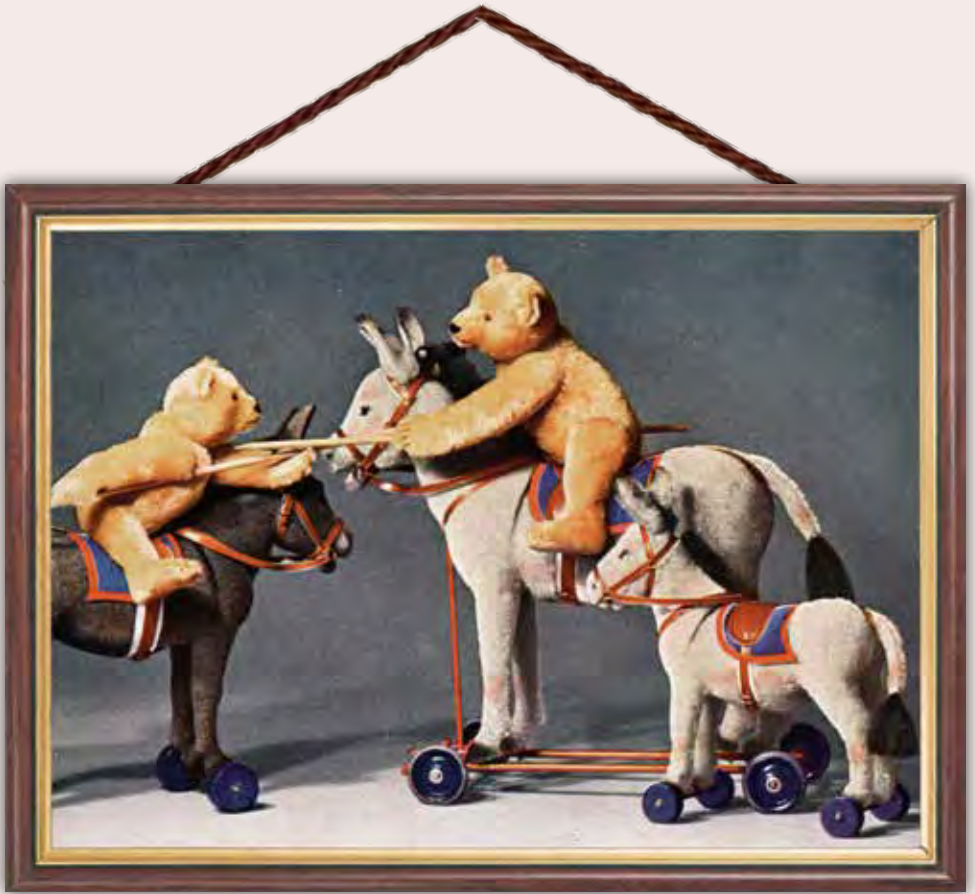
Werbefoto aus dem Steiff Katalog von 1929

Treuer Begleiter aus früheren Zeiten – der kleine Esel war schon damals beim „Ritterturnier unter Bären“ der Begleiter zweier größerer Kollegen – nun steht er selber im Mittelpunkt! Der „neue“ kleine Esel (Art.-Nr. 403194) sieht seinem historischen Vorbild (auf Abbildung ganz rechts) zum Verwechseln ähnlich!