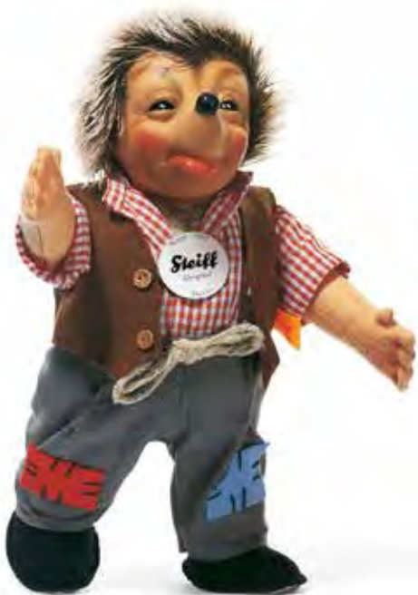
MECKI B abwaschbar 28 cm, Art.-Nr. 350153 UVP 149,00 Euro