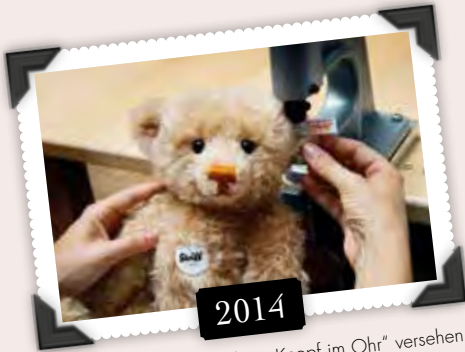
Ein Teddybär wird mit dem „Knopf im Ohr“ versehen