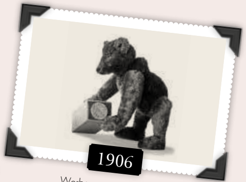
Werbeanzeige von 1906