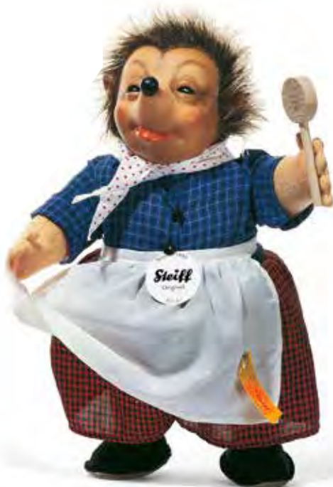
MICKI M abwaschbar 28 cm, Art.-Nr. 350658 UVP 149,00 Euro